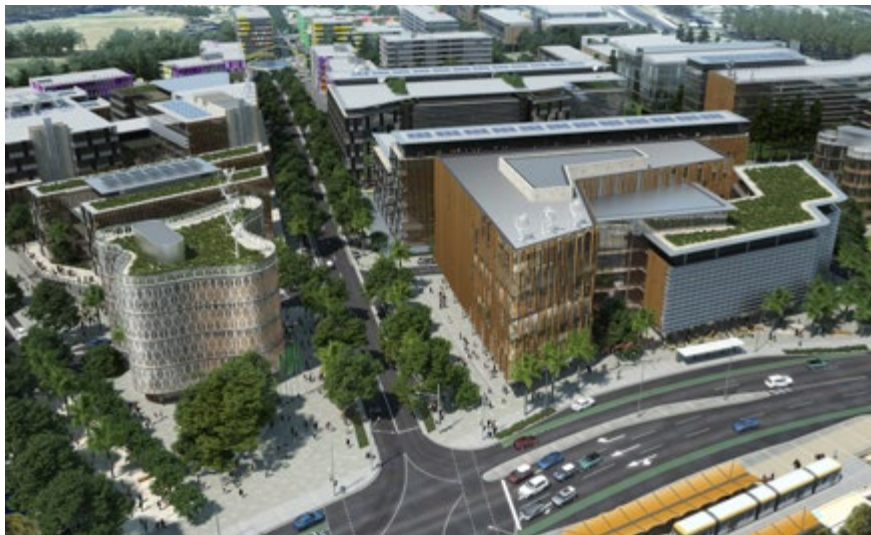
更多有关健康与知识的未来愿景